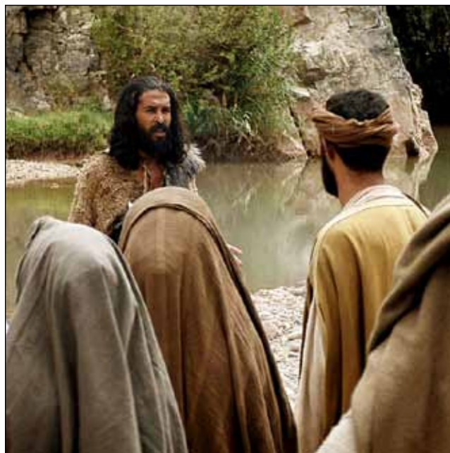
Ivan Krstitelj služi kod rijeke Jordana

Ova iskustva ukratko opisuju Ivanovo životno djelo objavljivanja Isusa, i isto tako nam pružaju uvid u naše djelo na kraju Evandeoskog doba. Prvo iskustvo pokazuje kako Ivan Krstitelj objavljuje Isusa svojoj majci i Mariji. Drugo iskustvo pokazuje Ivana Krstitelja kako objavljuje Mesiju svojoj duhovnoj djeci. Oba primjera svjedoče vjerodostojnost Isusa ljudima kojima je ili bilo potrebno ohrabrenje ili su bili duhovno gladni. Elizabeta i Marija su zasigurno bile u stanju čuđenja