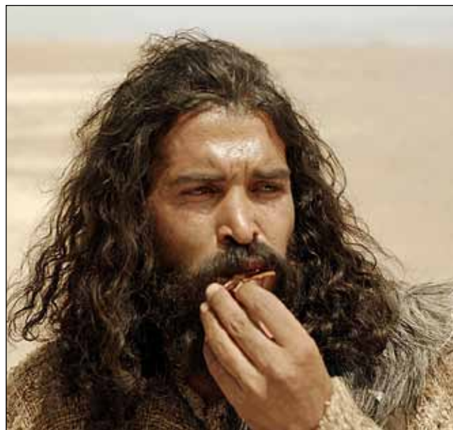
Askestski život i jednostavna prehrana

Ovaj snažan karakter je ono čemu se Bog najviše divi kod svojih slugu: potpuna predanost vršenju Njegove volje, bez obzira na izazove s kojima se suočavaju. Ivan je razumio da mu je Bog dao zadatak, i mi bi trebali razumjeti istu Božju direktivu u našim životima. Svi koji su pozvani od Boga pozvani su s razlogom. Svi imaju jedinstvene darove i talente koje je naš Gospo-