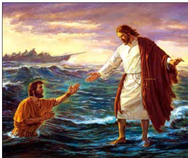
Isus spašava Petra

Petrov ribarski obrt nije mu davao vremena da bude uronjen u proučavanje proročanske riječi poput Savla iz Tarza. Međutim njegova vještina i emocionalna pre-