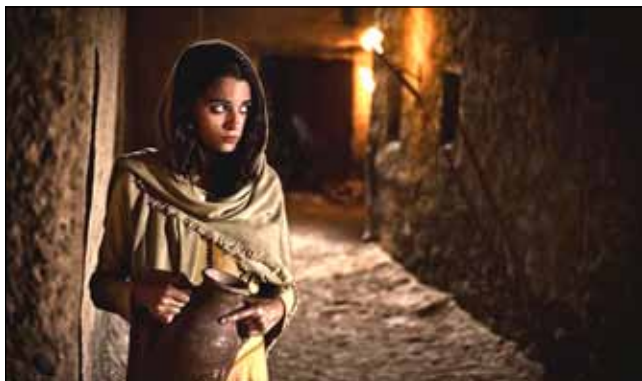
Rahaba u Jerihonu

Planirajući osvojiti ograđeni grad-državu Jerihon, „Jošua, sin Nunov, potajno je poslao iz Šitima 4 dvojicu