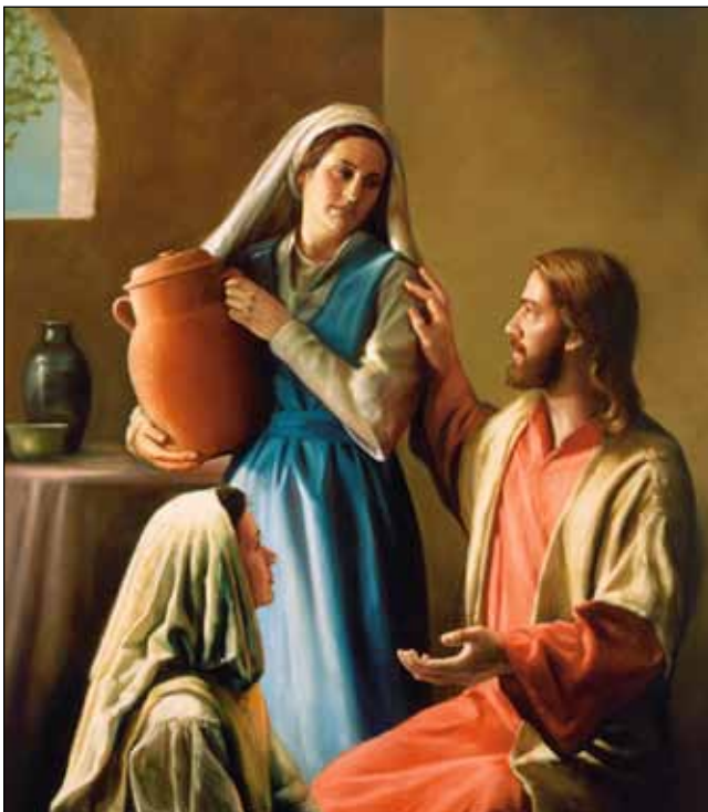
Marija, Marta i Isus

Razočaranje je bilo opipljivo. Nije bilo odgovora njihovim prijateljima koji su pitali zašto Isus nije došao. Stigla je vijest da Isus dolazi, i Marta je brzo istrčala iz kuće i pošla mu u susret. Njezine su riječi bile iskrene, izražavajući njezino razočaranje i njenu vjeru. „Gospodine, da si bio ovdje, brat moj ne bi umro. Ali i sada znam da će ti Bog dati sve što od njega zatražiš“ (Ivan 11:21,22).