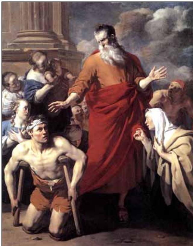
Pavao liječi u Listri

mnoge obogaćuju, kao oni koji nemaju ništa, a ipak imaju sve“ (2.Korinćanima 6:4-10).