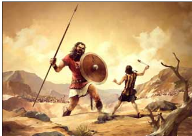
David, opremljen s vjerom

Gornji odlomak pruža smisaoni uvid u Davidovo srce. U svojim mladim danima, mogao je ubiti Šimija, jednako kao što je htio ubiti Nabala (1.Samuelova 25:22). David je ponizno prihvatio okolnosti kao pouku odozgo i čekao je na Božje izbavljenje, čak i u žaru kušnje. To je u oštroj suprotnosti sa Šimijem, koji je tvrdio da zna Božju konačnu presudu. To je također važna pouka za Kršćanina. „David je zatim rekao Abišaju i svim slugama svojim: Evo, moj sin, koji je od mene izišao, traži dušu moju, pa kako onda ne bi ovaj Benjaminovac! Pustite ga neka me proklinje, jer mu je Jehova tako rekao! Možda će Jehova vidjeti očima svojim, pa će mi Jehova uzvratiti dobro za riječi kojima me ovaj danas proklinje“ (2. Samuelova 16:11,12).