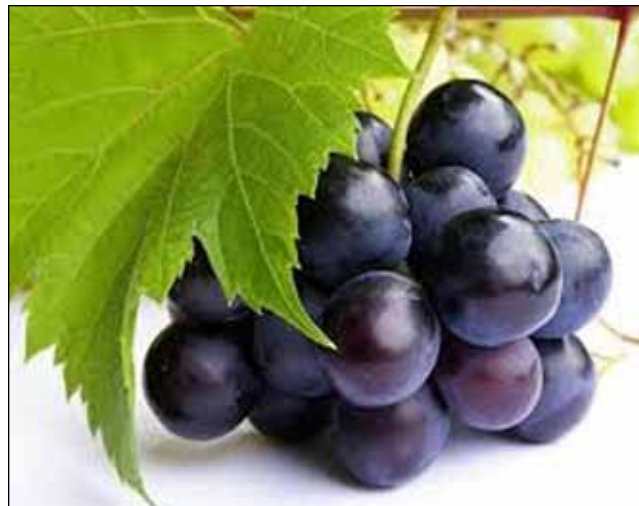
Plodovi duha razvijaju se kroz kušnje

Razočarenje — Ponekad nas Bog razočara. Ili točnije ponekad nas naša očekivanja od Boga razočaraju. U redu je pitati „Zašto?“ poput Davida (Psalmi 10, 13, 22, 28). Bog već zna kako se mi osjećamo, kao što je i Isus već znao kako se Marta osjećala. Marta je postavila Isusu svoje pitanje, i zatim je izrazila svoje konstantno pouzdanje u njega. Kada mi izrazimo naše razočaranje,