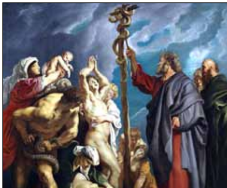
Mojsije podiže zmiju u pustinji

danje u naša iskustva i naši napori da razvijemo bolju spretnost pomoći će nam postati boljim slugama. Božji zadatak za Mojsija bio je toliko velik da je trebalo dvije trećine Mojsijevog života da ga pripreme za njega, i Mojsije je bio zaslijepljen u odnosu na to sve do iskustva kod gorućeg grma. Slično tome Bog sada uvježbava nas za naše buduće djelo — ne samo za naša buduća iskustva i prilike da služimo, nego također i za našu službu s one strane zastora, detalje