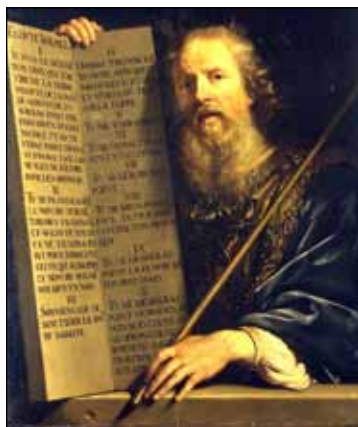
Mramorni prikaz Mojsija

Nema ničeg što bi bilo preveliko za Boga! Bog također upravlja i našim životima i Njegov se svrhovit plan može