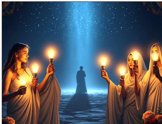
Naše bi svjetiljke trebale biti uređene i gorjeti.

Rezultat progovaranja Božjeg glasa je “zemlja se rastopi”. Apostol Petar vjerojatno se nadovezao na upravo