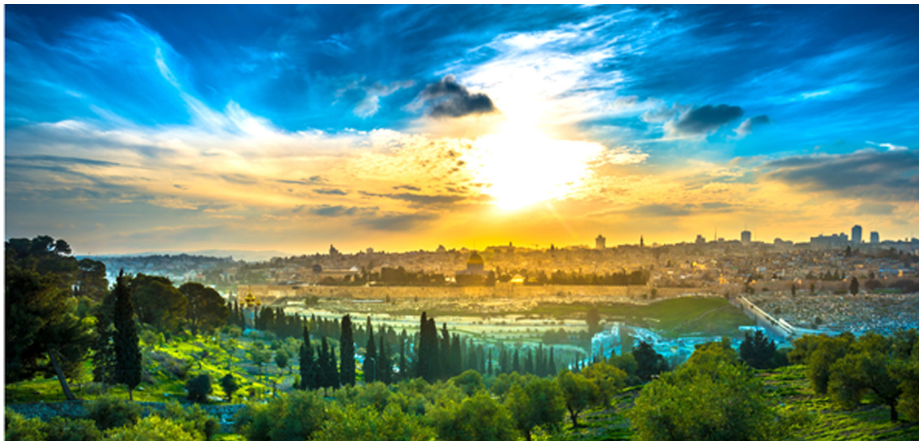
Zemlja Izrael danas

Mnogima bi se moglo učiniti da će Židovima još jednom zaprijetiti uništenje. No, oni se mole svom Bogu Jehovi za odgovor. Izraz “Bog Jakovljevi” koristi se nekoliko puta u Pismu u vezi s događajima na kraju Evangeoskog doba, što nam daje vremensku primjenu. (Vidi članak o Psalmu 46 u ovom izdanju.)