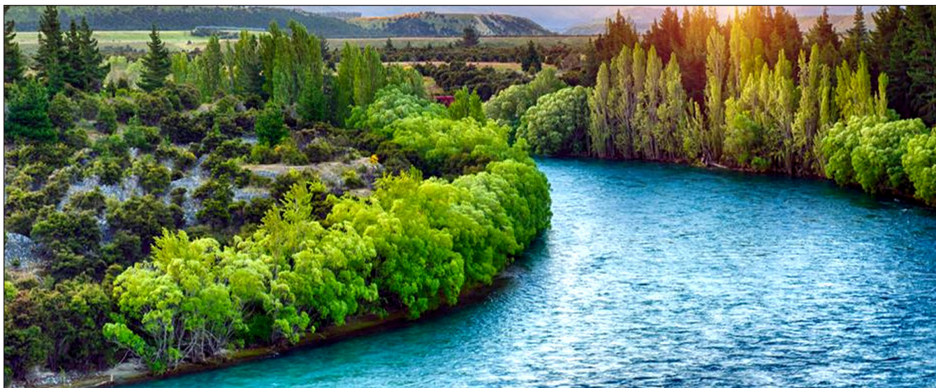
Rijeka života teći će u Kraljevstvu.

pronalaska skrovišta koja će ih izolirati od tog sukoba će propasti (Hošea 10:8, Luka 23:30).