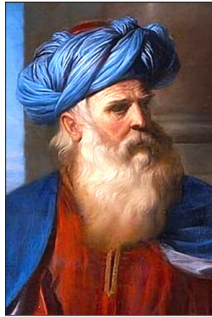
Isus je Abrahamovo sjeme

Ove riječi prenose krajnju agoniju koju je Isus morao podnijeti. “Doista, nikada tuge nisu bile nalik njegovim tugama... bič i koplje, i trnova kruna. ... Tko može slušati o duši tako napaćenoj da se razlijeva kao voda, dok su sve kosti njegova tijela iščašene, a zatim gledati Isusa prikovanog na križ, i kako samo podizanje... iščašuje, iako ne lomi, kosti njegova svetog tijela ... I zar Isus nije bio isušen, dok mu se jezik lijepio za nepce, kada je rekao: ‘Žedan sam.’ Ukratko, u svim okolnostima, u njegovim udarcima, patnjama, raspeću, umiranju i smrtnoj prašini u koju je bio bačen, da je prorok [David] bio u Pilatovoj dvorani i na brdu Kalvariji, jedva da bi mogao napraviti točniji portret Jaganjca Božjeg od onoga kojeg je ovdje načinio” (Robert Hawker, anglikanac, 1753.-1857.).