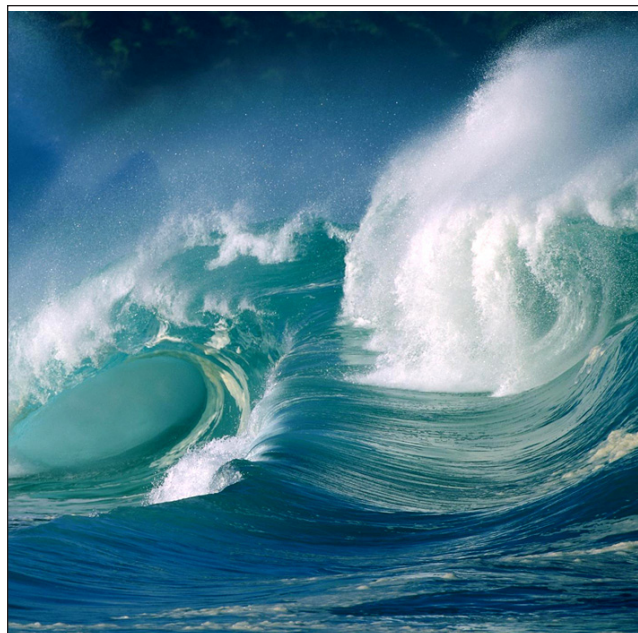
More i valovi buće.

Ključna, praktična lekcija za nas je da se ne bojimo ovih stvari. Vidimo rastući gnjev u “vodama”, masama čovječanstva. Gledamo propadanje u našim gradovima. Promatramo mržnju i frustraciju u masama zbog percepciji