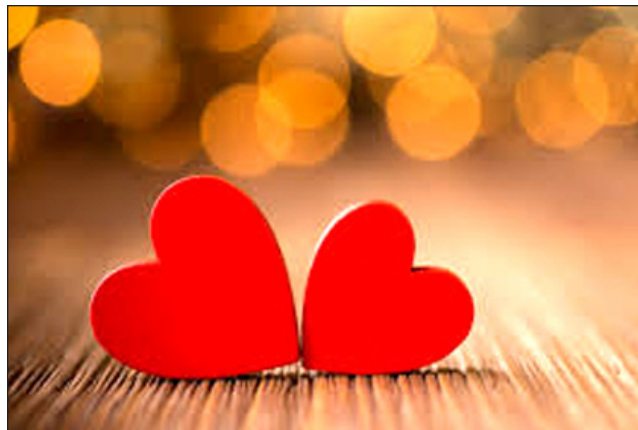
Ljubav će nadvladati zlo.

Stih 6 doista objavljuje da će zemlja biti ispunjena „truplima”. U ratu za uspostavu pravednosti koji će vodi-