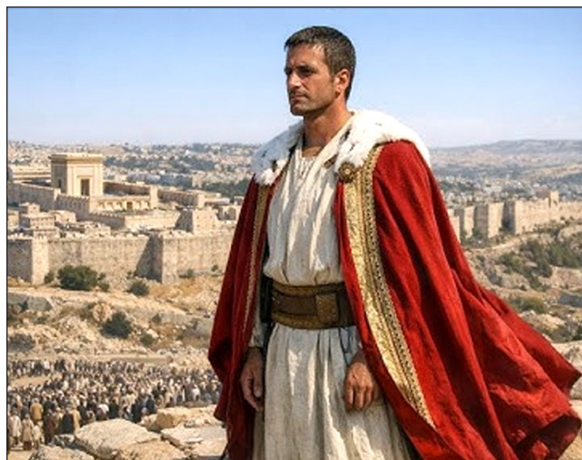
Davidova vladavina simbolizira Isusovu vladavinu.

Isus je naš Kralj i Svećenik trenutačno, tijekom evandeoskog doba (Hebrejima 8:1). Tijekom Kraljevstva, Isus će služiti kao Kralj i Svećenik za svijet, zajedno s Crkvom, proslavljen s njom na nebu (Otkrivenje 20:6). Ova dva segmenta Isusove vladavine simbolično se povezuju s dva dijela Davidove vladavine — sedam godina nad vlastitim narodom, Judom, i ostatkom njegove vladavine nad cijelim Izraelom (2. Samuelova 2:11; 1. Kraljevima 2:11).