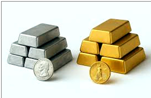
Srebro i zlato bit će zamijenjeni ljubavlju i brigom.

Aronovim svećenstvom. Bilo je to kraljevsko svećenstvo, baš poput Melkisedekovog. „Proglašen od Boga velikim svećenikom po redu Melkisedekovu” (Hebrejima 5:10).