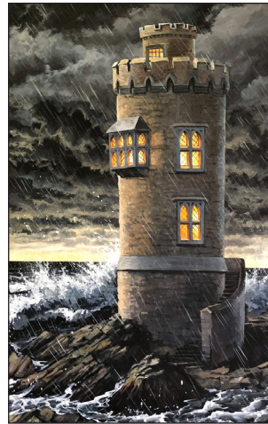
Jehova je naša tvrda kula.

“Doista, mi razumijemo da će ‘Jakovljeva nevolja’ u Svetoj zemlji doći na samom kraju Harmagedona. Tada će se Mesijansko Kraljevstvo početi očitovati.” (Svezak 4, Predgovor, stranica xvi).