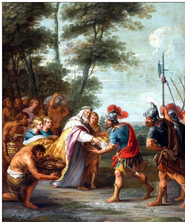
Melkisedek blagoslivlja Abrahama.

Daniel se ovdje poziva samo na Boga. No, Jehova Bog provodi ovaj plan preko svog Sina. To je objavljeno u Psalmu 2:2-6: „Ustaju kraljevi zemaljski, knezovi se udružuju protiv Jehove i pomazanika njegova: ‘Raskinimo okove njihove i jaram njihov zbacimo!’ Smije se onaj