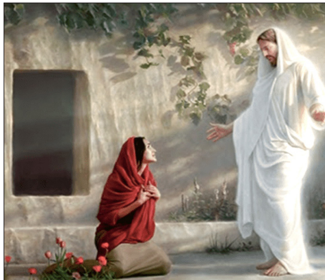
Isus, uskrišen iz mrtvih

Prorok Izaija preorekao je da na njemu neće vidjeti ni lika ni ljepote (Izaija 53:2). Apostol Pavao je potom