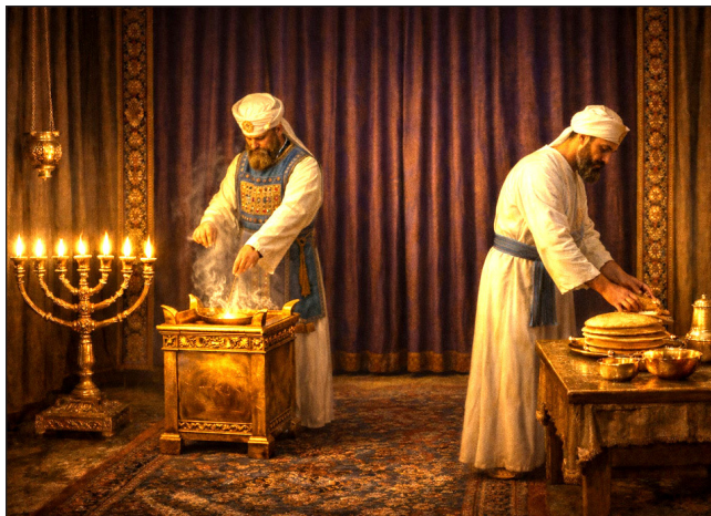
Služenje u Svetinji.

“Zato, ljubljena braćo moja, budite postojani, nepokolebljivi, uvijek obilujući u djelu Gospodnjem, znajući da vaš trud nije uzaludan u Gospodinu” (1. Korinćanima 15:58).