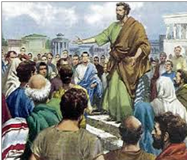
Pavao u Pizidiji.

je primio život na višoj razini od one koju je imao prije dolaska na zemlju. Nije mu jednostavno vraćen prijašnji status. Primio je novu prirodu, uzvišeniju slavu i položaj.