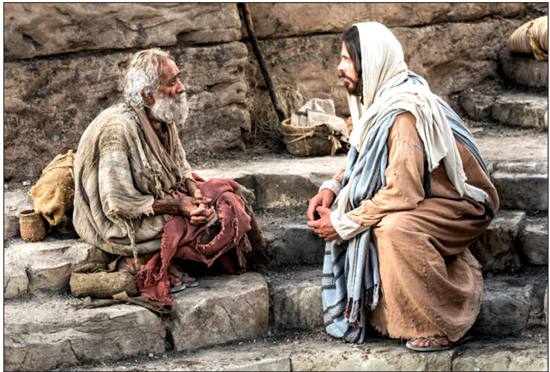
Isus je iskazivao ljubav tijekom svoje službe.

„Ali kad je ojačao, srce mu se uzoholilo na njegovu propast; ogriješio se o Jehovu, svoga Boga, jer je ušao u Jehovin Hram da prinese kad na kadionom žrtveniku” (2. Ljetopisa 26:16).