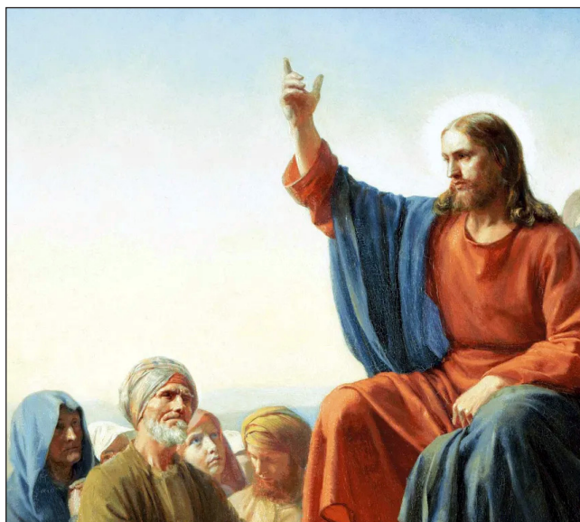
Isus, koji će umrijeti na križu

Isus je bio poslušan Ocu kroz nebrojena prošla doba. Ali poslušnost pod tako ekstremnim uvjetima dok je bio na Zemlji iskušala je njegovu odlučnost kao nikada prije. Njegovo nepokolebljivo pouzdanje i predanost Bogu postali su mjerilo za svakog vjernika. Oni potvrđuju da njihov vođa razumije borbe i želju da se ostane vjeran Bogu, čak i suočen s ekstremnim kušnjama. U stvarnosti, Otac nije ostavio Isusa. Uskrsnuo ga je u božansku narav, što je jasan znak Očeve ljubavi i odobravanja (Otkrivenje 5:12). No, to je iskustvo bilo nužno kako bi Isus postao