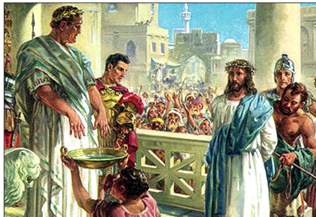
Mnogi su ispaštali zbog svog postupanja prema Isusu.

Gospodnjem narodu se savjetuje da bude strpljiv u pobožnom ponašanju, baš kao što je bio Isus. “Smiri se pred GOSPODINOM i strpljivo ga čekaj ... Okani se srdžbe i ostavi gnjev: ne žesti se, da ne bi zlo učinio” (Psalam 37:7,8). “Snago moja, tebe ću čekati: jer Bog je