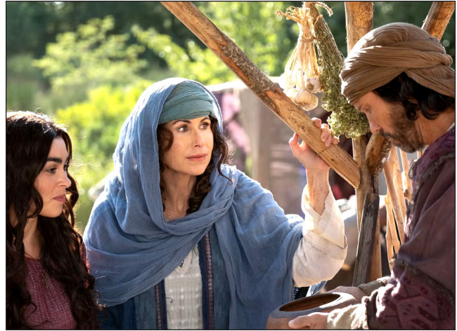
Vjerni iz Starog zavjeta

Poglavlje se zatvara sa 17. stihom: “Učinit ću da se tvoje ime slavi u svim naraštajima; stoga će te narodi