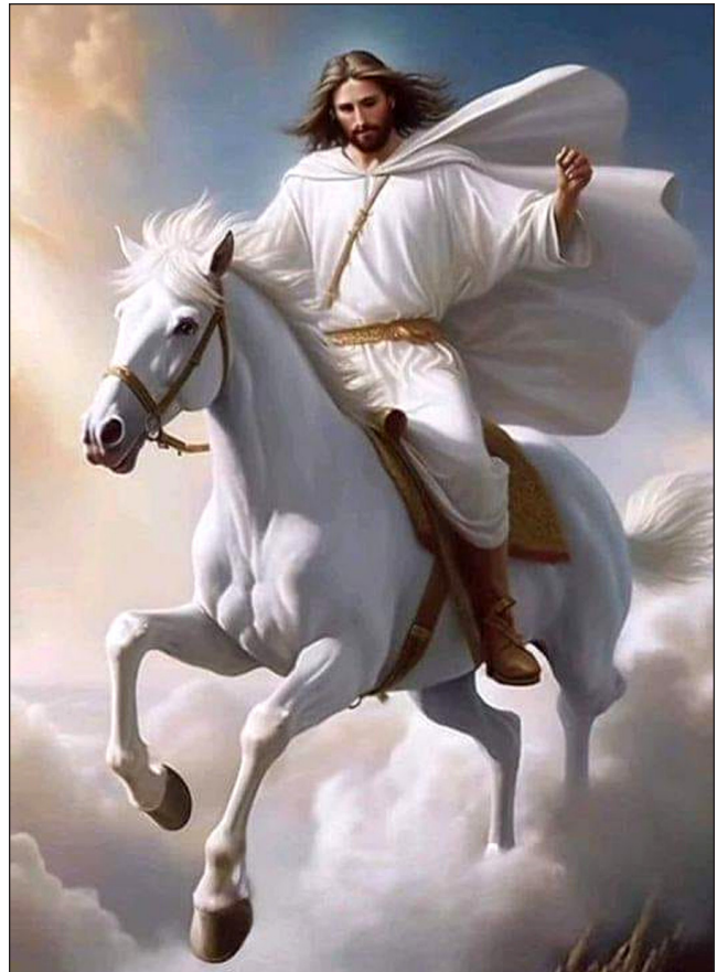
Isus jaše s autoritetom

Psalam 133:2 opisuje ulje koje teče niz Aronovu bradu do ovratnika njegovih haljina. Ovaj opis “dragocjenog ulja” koje teče niz bradu uspoređuje se s braćom koja žive zajedno u jedinstvu u Psalmu 133:1. To nas također može